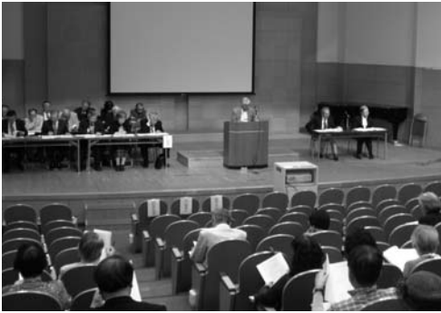
平成23年度通常総会—常盤木学園シュトラウスホール

平成二十三年の宮城県芸術協会総会は、未曾有の災害をもたらした東日本大震災のため当初の開催日程が延期となり、六月十一日午後二時四十分より常盤木学園シュトラウスホールで開かれた。東日本大震災における本協会の対応、公益法人移行準備委員会の検討状況などについての報告があり、二十二年度の事業報告と収支決算、二十三年度