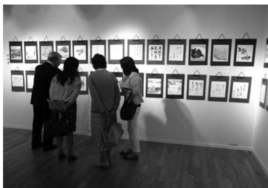
札幌のギャラリーに展示された短詩型文芸・美術色紙作品展。

後継者育成事業の現況②東日本大震災における各道県芸術文化に対する影響とその対応③公益法人への移行の進捗状況の三件で、各道県の実情について活発な意見交換が行われた。特に今回は三月十一日発生した東日本大震災に関する情報交換が中心となり、協議の結果、当協議会の会長・副会長名で岩手・宮城・福島知事と議会議長に、県立文化施設の早期復旧と芸術文化関係予算の充実に関する要望書を提出することが決められ